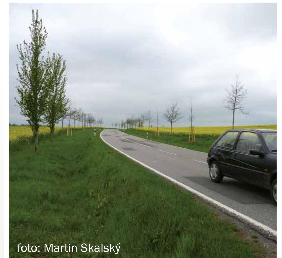
Nově vysazované stromy by měly růst až za příkopem, optimálně 4,5 m od krajnice.