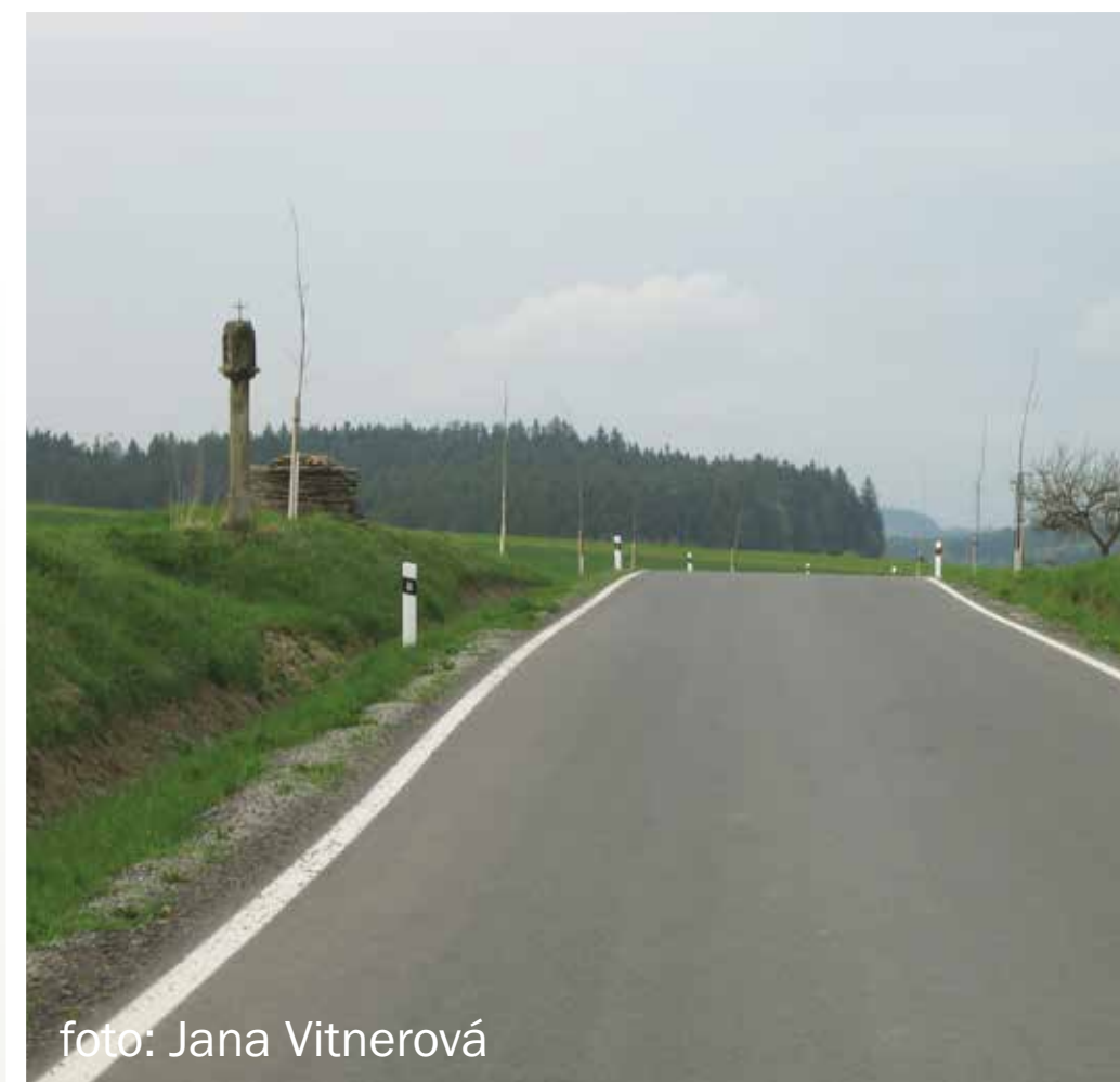
Stromy zasazené na náspech by měly kopírovat jeho horní hranu.

K výsadbám je vhodné vybírat domácí dlouhověké stromy, např. javory, duby nebo lípy. Aleje bývají zpravidla jedno-druhové, aby byly kompaktní. Je potřeba také zvážit možné opadávání plodů na vozovku (kaštiny, ovoce).