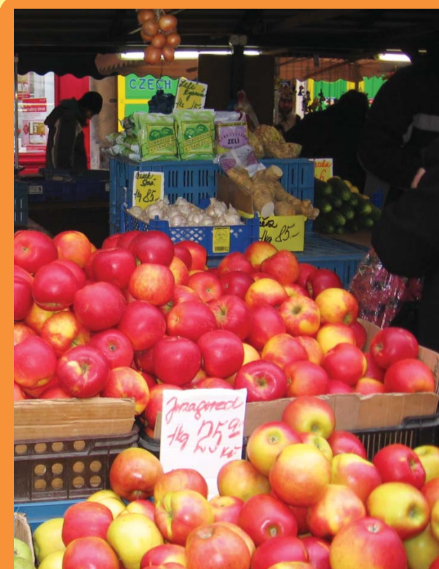
Na trhu si můžete nakoupit čerstvou zeleninu a ovoce přímo od pěstitelů. Havelský trh v Praze.

Existuje mnoho dalších možností, jak snížit svoji spotřebu obalů. Například pitím vody z vodovodu. Pokud necháte vodu 15 minut odstát, zbavíte se nepříjemné chuti chlóru. Ještě lepší je přinést si vodu přímo ze studánky. Další cestou je nakupovat zboží v obalech, které jdou dobře recyklovat. Z plastů je to PET, LDPE, HDPE, PP. Dobré je vyhnout se obalům z PVC a nekupovat hliníkové obaly, protože se netřídí.