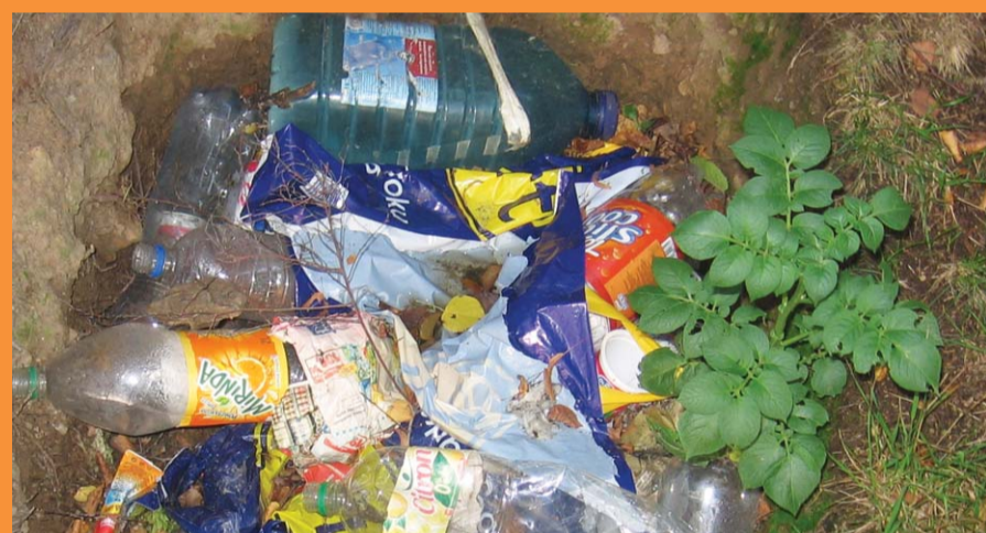
Odhozené obaly v přírodě. Většina z nich lze dobře recyklovat.

Nárůst spotřeby obalů v ČR.