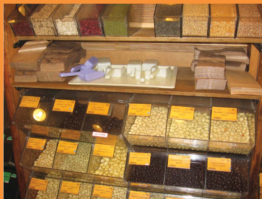
Bezobalový prodej v prodejně Country Life v Melantrichově ulici v Praze.

Z pohledu ochrany životního prostředí je nejlepší obaly používat opakovaně. Platí to jak o vratných lahvích, tak i o dalších obalech. Například látková taška může nahradit několik set tašek na jedno použití (odhad roční spotřeby plastových tašek v ČR je 150 až 300 kusů na 1 obyvatele). I když je pravda, že plastové tašky se používají do odpadkových košů, proč s nimi plýtvat. Opakovaně lze používat také papírové a plastové sáčky.