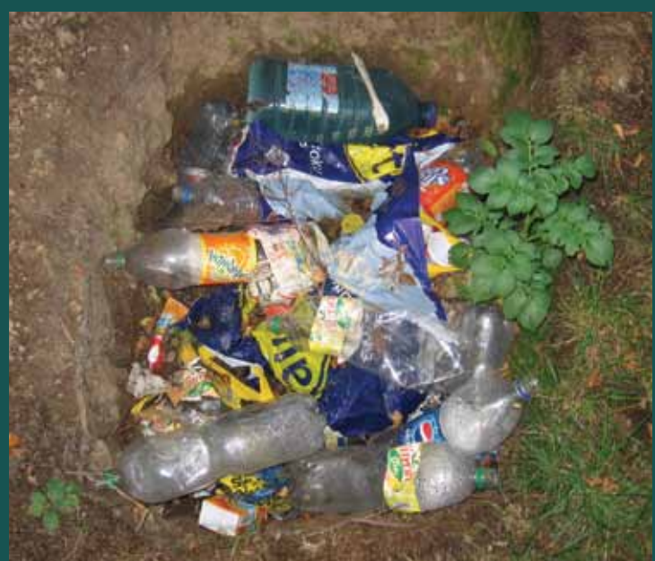
Odstraňování černých skládek (v přepočtu na 1 tunu odpadu) je drahé.