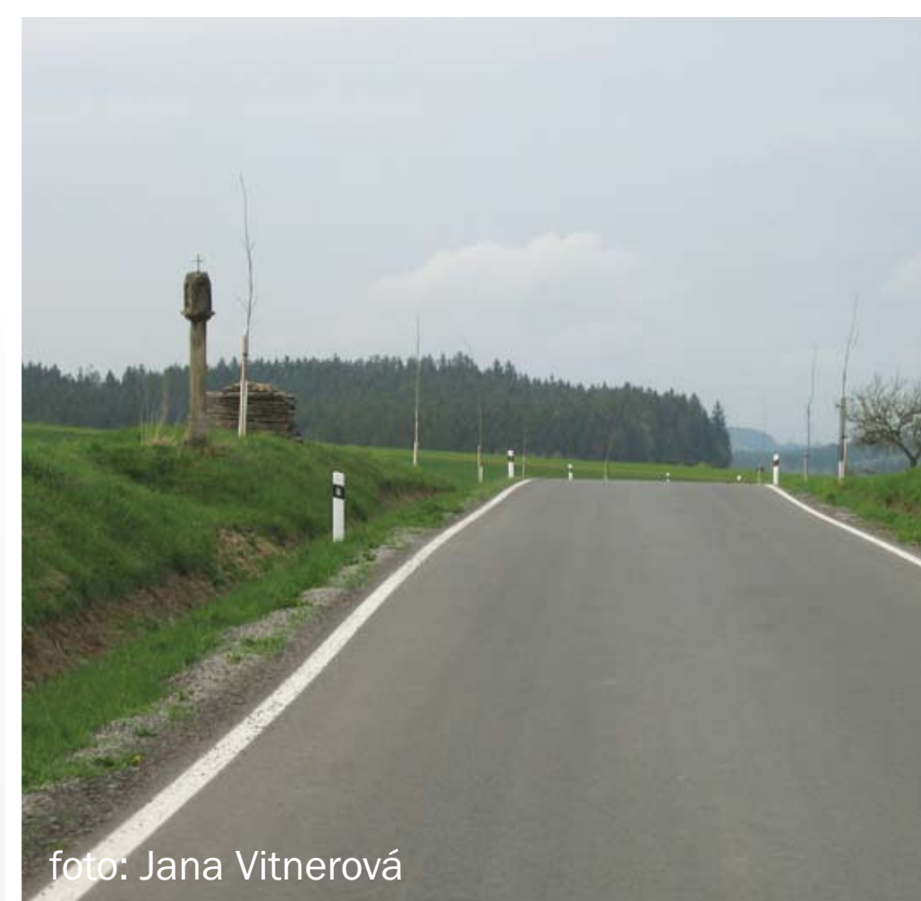
Stromy zasazené na náspech by měly kopírovat jeho horní hranu.

K výsadbám je vhodné vybírat domácí dlouhověké stromy, např. javory, duby nebo lípy. Aleje bývají zpravidla jedno-druhové, aby byly kompaktní. Je potřeba také zvážit možné opadávání plodů na vozovku (kaštiny, ovoce).