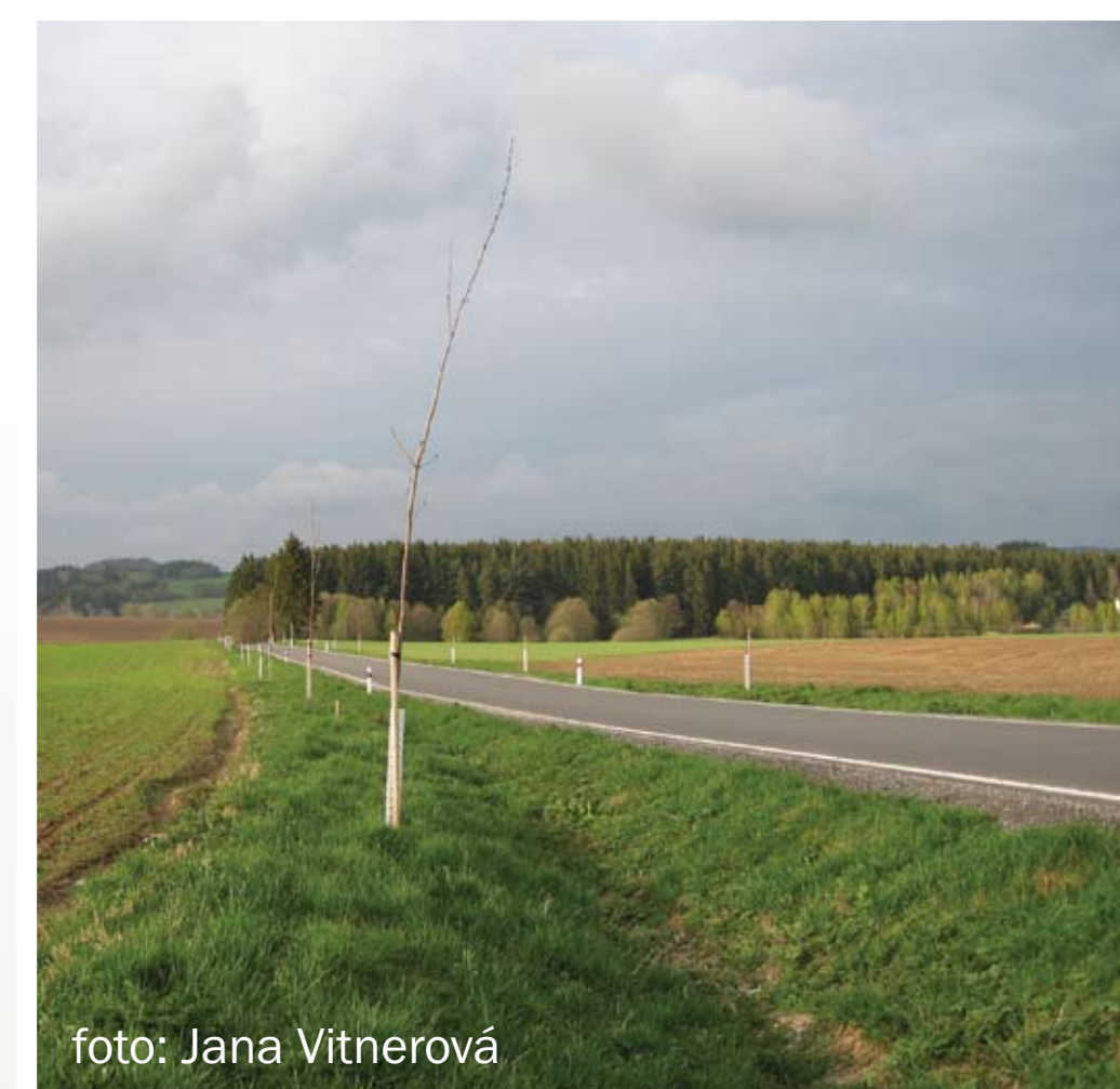
Nově vysazované stromy by měly růst až za příkopem, nejbližší 4,5 m od krajnice.