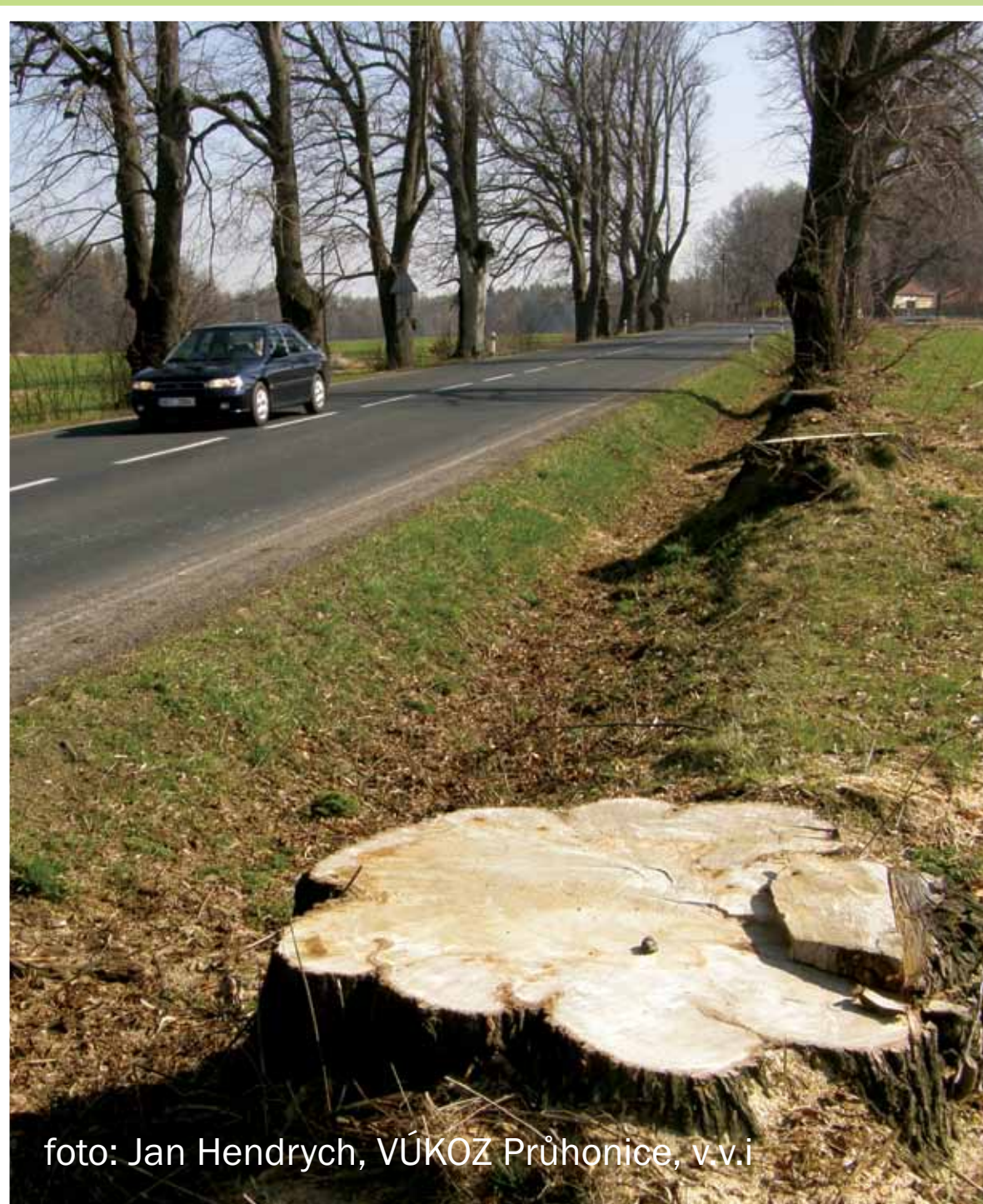
Koněprusy, okres Beroun, Středočeský kraj