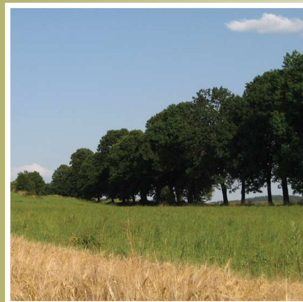
Lipová alej z Třeště do Čenkova

Pětikilometrová lipová alej vede z Třeště do Čenkova a Růžené. V roce 2007 měla být celá vykácena při opravě vozovky. Poté, co k zemi padlo několik zdravých stromů, zakázala další kácení Česká inspekce životního prostředí.