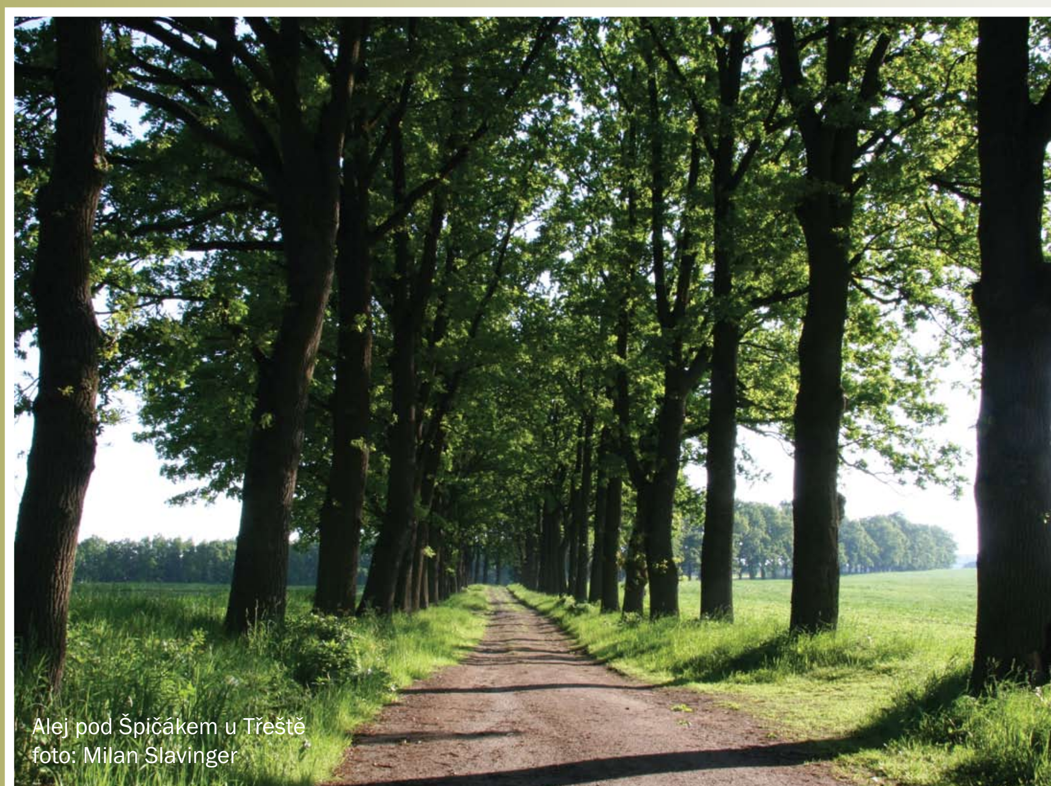
Aleje pod Špičákem u Třeště

V lese pod Špičákem stojí v místě, kde se schází pět cest, kamenný obelisk. Z Třeště sem přichází cesta lemovaná alejí 179 dubů starých 180 let. Počátkem minulého století se alejí z Třeště pořádaly výlety s hudbou.