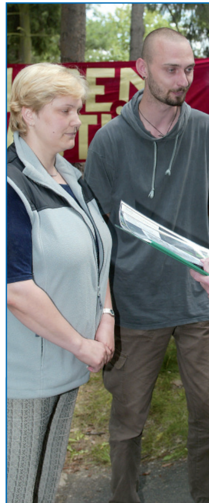
V průběhu návštěvy prezidenta Havla v M... Havlovi žádost o pomoc při záchraně les... prostoru. Škoda Auto tam chtěla stavět p...