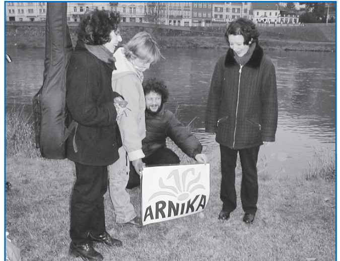
Mezi prvními členy Arniky byly dnes již proslulé Sestry Steinovy. Na fotografii z listopadu 2001 symbolicky překračují logo a vstupují do Arniky.

Má pravdu. Kampaň Šetrné papírování patřila k těm neúspěšnějším. Díky ní se Arnice podařilo přesvědčit Ministerstvo životního prostředí ČR, Senát a řadu dalších úřadů, aby při své práci začaly více používat recyklovaný papír.