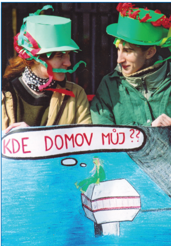
Arnika uspořádala protestní průvod hasťmanů proti zatopení obce Hové Heřmanovy na Bruntálsku při výstavbě nové plánované přehradě. Přehrada je podle Arniky drahá a zcela zbytečná.