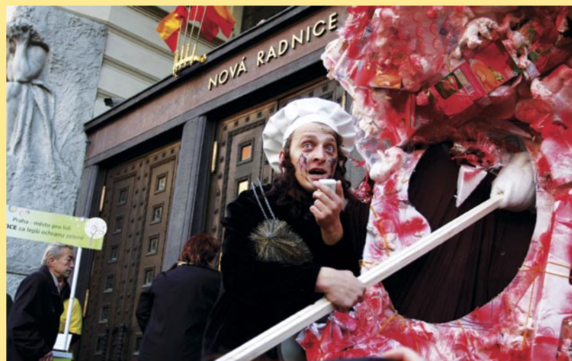
Na jednom z happeningů čistili kominíci symbolické ucho pražského magistrátu. Lidé žádali politiky, aby naslouchali jejich názorům.

V roce 2009 zveřejnil pražský magistrát koncept nového územního plánu. Lidé měli k nastudování stovek stran pouhý měsíc času v době adventu. Přesto vzniklo více než 30 občanských iniciativ a 18 tisíc lidí podalo námítky. Současně začal magistrát projednávat přes 300 změn starého územního plánu. Zhruba polovina z nich by umožnila developerům stavět v zeleni a pozemkoví spekulanti by mohli vydělat desítky miliard. I když dosud není jasné, jaká budoucnost Prahu čeká, stále více lidí požaduje, aby územní plán zajistil podmínky pro kvalitní život.