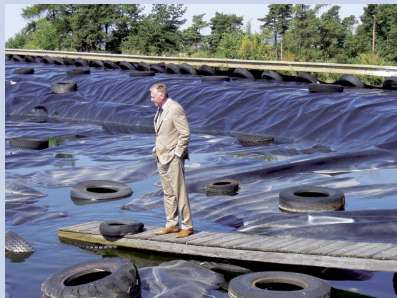
Ze skládky unikaly jedy až do roku 2008. Kauza dospěla tak daleko, že se na havárii přijel podívat tehdejší premiér Topolánek. Stát pak skládku odkoupil a zajistil její likvidaci.

V roce 1996 došlo na skládce nebezpečných odpadů v Pozďátkách na Třebíčsku k vážné havárii – do potoka Markovky unikla kyselina sírová a těžké kovy. Majitel zkrachoval. V roce 2002 koupila skládku italská firma ICKM a chtěla povolit pokračování provozu. Nabídla za to vyčistit zamořené prostředí. Obyvatelé ale s dalším navážením jedů nesouhlasili. Zastupitelé obce proto schválili nový územní plán, který počítal na místě skládky s výsadbou stromů. ICKM tak nemohla pokračovat ve skládkování, ačkoliv investovala desítky milionů do nákupu pozemků.