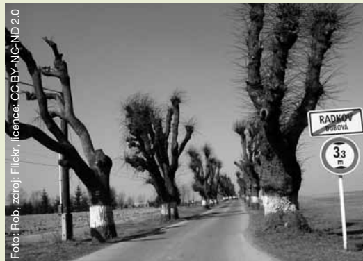
Lipová alej u obce Radkov Dubová, nad jejíž budoucností visí otazník.

Mám z toho velké obavy. V našem kraji je hlavně v menších obcích v zahradách velké množství mohutných dřevin, například u historických domů jsou často obrovské lípy, javory, duby. Pokud vím, tak obce, pokud tyto stromy nebyly nebezpečné, jejich kácení většinou nepovolovaly. Nyní se obávám, že jich hodně padne, přestože by tady