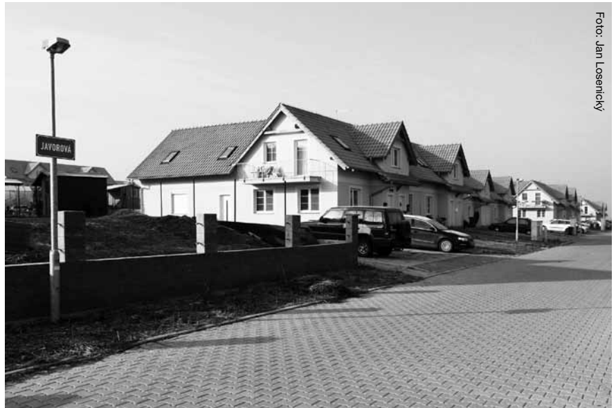
Javorová ulice, obec Hostivice.