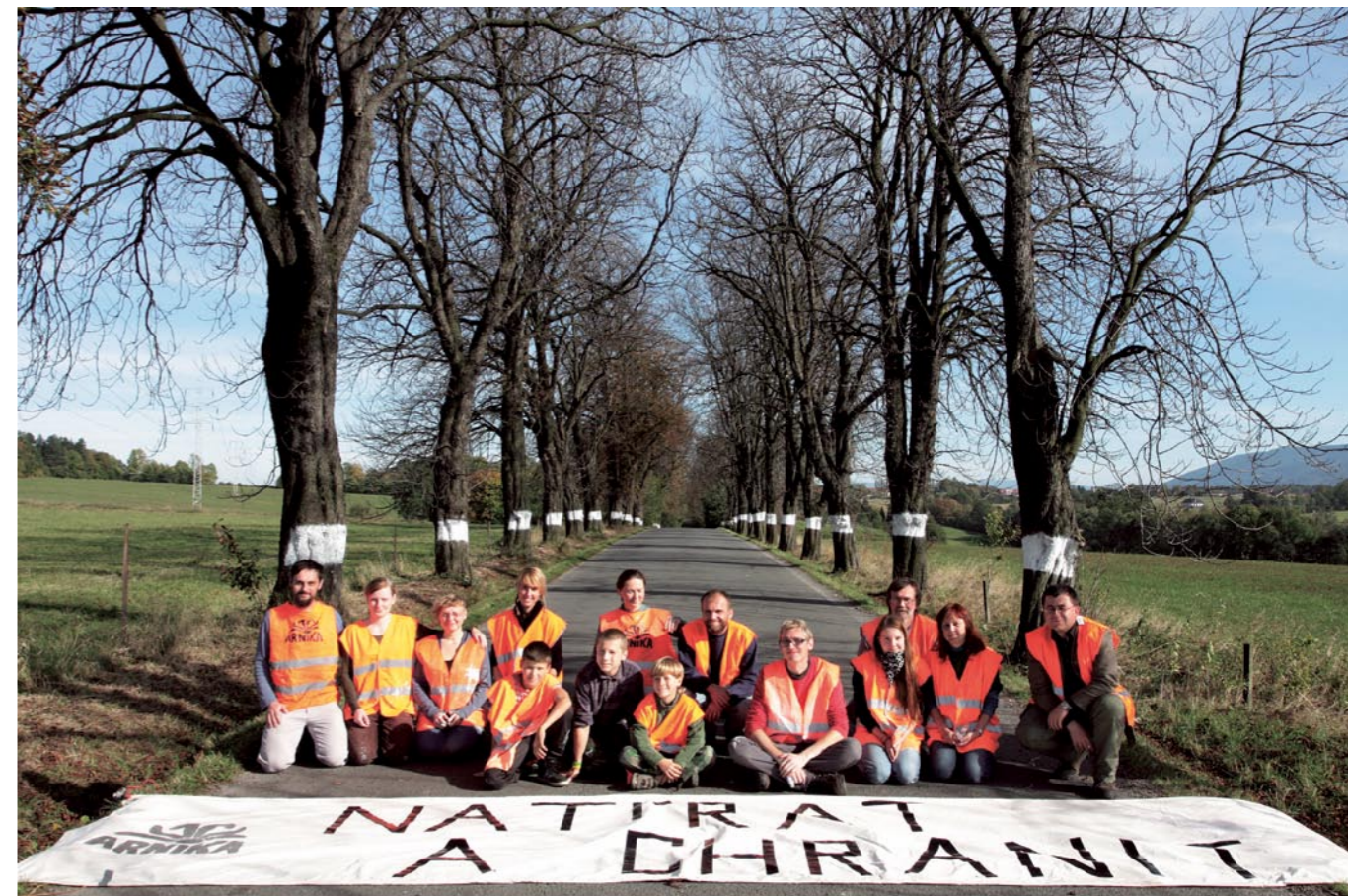
Díky dárcům Plechovky pro alej a dobrovolníkům jsme v říjnu 2013 natřeli alej u Dolních Tošanovic bílými bezpečnostními pruhy. Pro lepší bezpečnost silničního provozu není nutné hned kácet celá stromořadí.