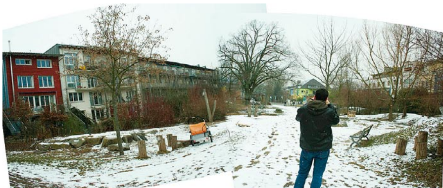
Parkové prostranství mezi domy

a parkují na místě k tomu určeném. Nejvyšší povolená rychlost je 30 km/h. Rodiče se proto nebojí, když si děti chodí hrát ven. Jezdí se tady málo a opatrně, říká Wulf Daseking. Výhodou „neparkování“ je i to, že tím jediným veřejným prostorem není právě parkoviště, jak tomu často bývá v Praze nebo v jiných městech.