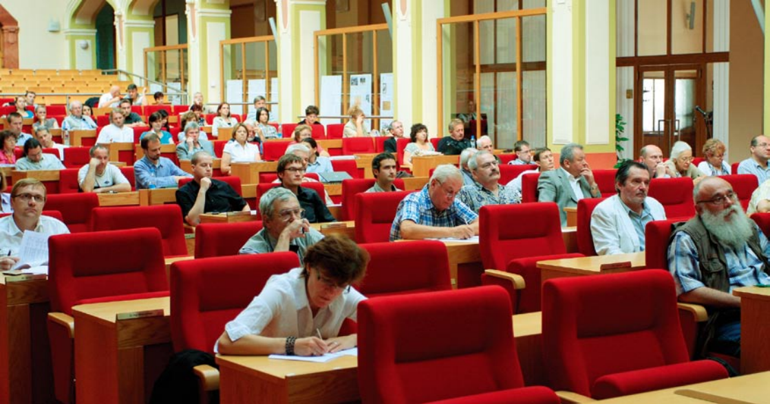
Zástupci veřejnosti, městských částí a různých úřadů na projednávání územního plánu.

a poskytuje základní jistotu jak občanům, tak i developerům, majitelům nemovitostí a státním úřadům. Jeho časté změny naopak nahrávají spekulacím a vyvolávají obavy z možné korupce.