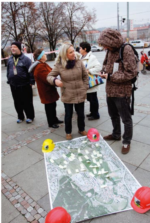
V listopadu 2013 uskutečnila Arnika happening „Pomozte nám stavět mrakodrap v centru Prahy!“, který měl upozornit na plány developerů.

I když IPR formálně připravuje veškeré koncepce včetně územního plánu, konkrétní rozvojové tendence jsou usměrňovány politiky. To je opět logické, avšak při nedostatečné participaci veřejnosti v celém procesu dochází nápadně často k prosazování partikulárních zájmů, poškozujících město a jeho obyvatele (a můžeme předpokládat, že motivem mnoha takových rozhodnutí je korupce). Nejlépe to dokumentuje přijímání změn a úprav dnes platného územního plánu, které nenaplnují v řadě případů požadavky stavebního zákona (zejm. zabírají stále další volná prostranství, ačkoli takový postup stavební zákon výslovně zakazuje).