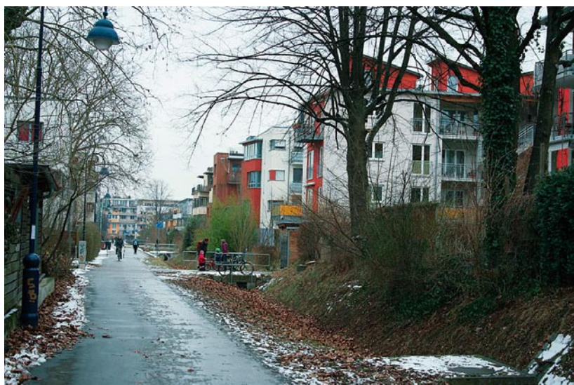
Cesta pro kola a pro pěší, koryto potoka

Téměř třetinu obyvatel tvoří lidé mladší 20 let. Vzhledem k tomu, že čtvrt leží na kraji města, lze pěšky dojít do lesa i k dalším přírodním rekreačním oblastem. Rieselfeld je občansky bohatě vybaven. Kromě několika škol, obchodů a restaurací má také sportoviště a společenské centrum. Své místo zde mají prostory pro komerční činnost i prostory průmyslového charakteru, nedaleko stojí továrna. Díky lokálním pracovním příležitostem nemusí tolik obyvatel za prací dojíždět. Výstavba probíhala obdobně jako ve Vaubanu za pomoci velkého množství subjektů.