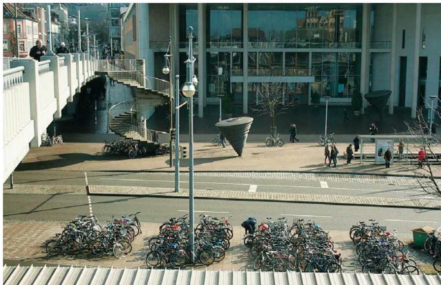
Poblíž vlakového nádraží

Obyvatelé, kteří kompostují organickou složku svého odpadu, mají nárok na úlevy od poplatků. Místní obyvatelé náruživě třídí odpad (údajně o tom kolují příběhy) a co se nevytřídí, končí ve spalovně, která dodržuje vysoké standardy pro životní prostředí a poskytuje elektřinu pro 25 000 domácností.