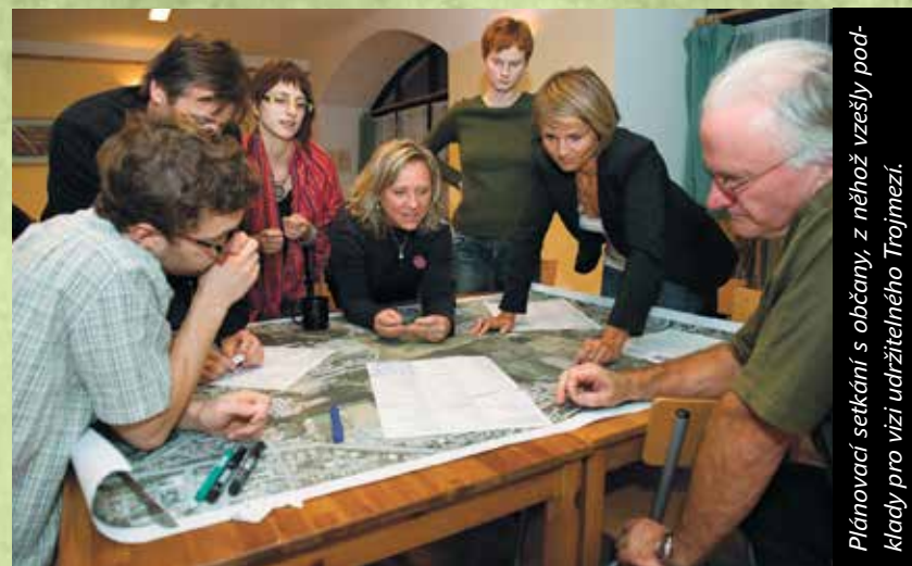
Plánovací setkání s občany, z něhož vzešly podklady pro vizi udržitelného Trojmezí.

Proti schválené změně územního plánu (i celému územnímu plánu) je možné podat žalobu . Soud pak posoudí, zda byly splněny všechny požadavky stavebního zákona a jestli je územní plán v pořádku.