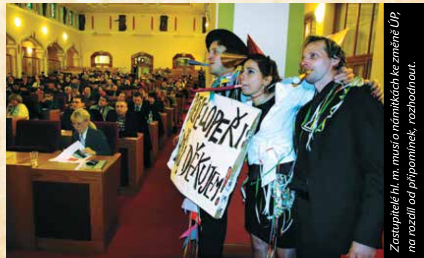
Zastupitelé hl. m. musí o námítkách ke změně ÚP, na rozdíl od připomínek, rozhodnout.

Do té doby musíme sledovat změny územního plánu . Developeri jich navrhuje stovky a na magistrátě se projednávají každý měsíc. Některé z nich řeší drobnosti, například přístavbu garáže. V mnoha případech jde ale o zásadní developerské projekty, které mohou navždy zničit prostředí Vaší ulice nebo i celé čtvrti. Lhůta na podání připomínek je pouze 30 dní, a aby vám neuplynula, je třeba průběžně sledovat úřední desku magistrátu nebo web Arniky zmenyprahy.cz . Z našeho webu si můžete rovněž nechat posílat aktuality.