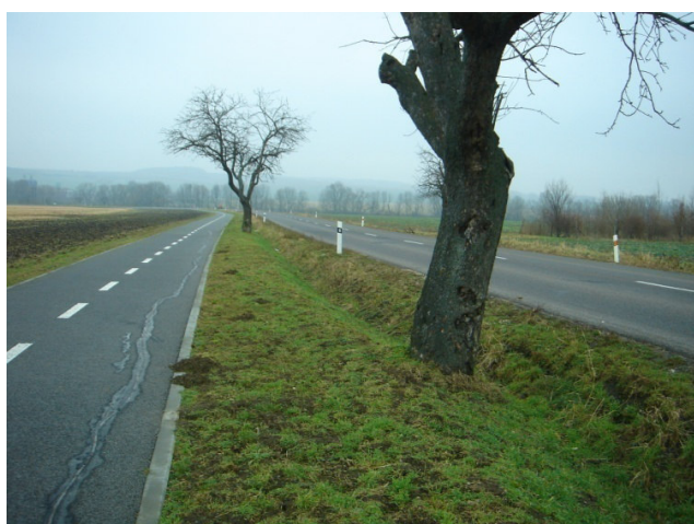
Dožívající jabloně při cestě ze Slavkova do Dolního Němčí. Letos zbytek stromů vykácen bez náhrady.