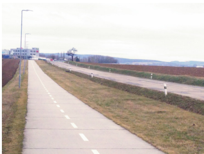
Poslední stromy zbyly z aleje trnek mezi Nivnicí a Uherským Brodem