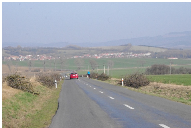
Vykácená a dodnes neobnovená třešňová alej mezi Nivnicí a Dolním Němčím