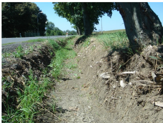
Poškozené kořeny stromů po údržbě silničního járku – směr z Dolního Němčí na Hluk