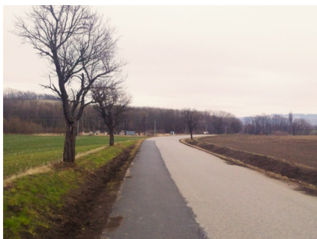
Dožívající alej kolem silnice z Nivnice do Suché Loze