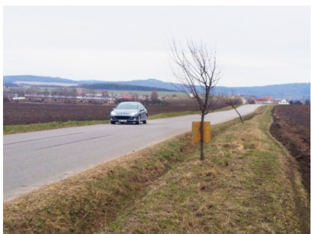
Zbytky neudržované výsadby u silnice za osadou Volenov u Suché Loze