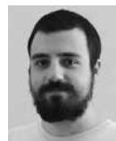
ARNIKA CENTRUM PRO PODPORU OBČANŮ

Existují samozřejmě právní cesty pro to, jak upravit nebo prodloužit platnost stávajícího územního plánu, třebaže je zastaralý a také může umožnit leccos, pořád by to mělo větší smysl, než kdyby Praha nakonec zůstala bez platného územního plánu. Osobně si myslím, že začít by se mělo od toho, aby si odpovědní plánovači vůbec uvědomili důležitost svojí pozice a s ní související odpovědnost. Hodně dobře to říká Ivan Rynda – ta pozice je stěžejní, protože ovlivňuje lidský život od nuly až po nekonečno tím, že designuje, normuje a reguluje žitý svět. Pouze důsledné uvědomění téhle pozice může přinést odpovědnou a efektivní regulaci, kterou Praha potřebuje. ■