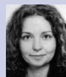
ARNIKA OCHRANA PŘÍRODY

Celou situaci pro vás samozřejmě nadále sledujeme. Labe nedáme. ■