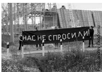
„Nikdo se nás neptal,“ říká banner běloruských aktivistů.

To se začalo formovat v devadesátých letech, byť plány na výstavbu ostrovecké elektrárny se poprvé objevily už o desetiletí dříve. Po havárii v Černobylu v roce 1986 je raději dlouho nikdo nevytáhal, nicméně v časech energetické kri-