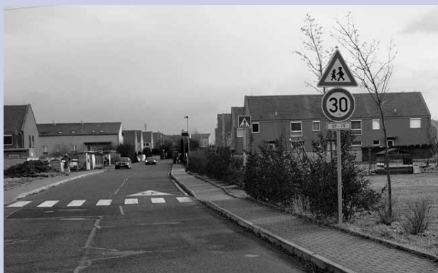
Střední Čechy – místo pro život, nebo jen pro bydlení? Studii o výstavbě v Jenštejně najdete na webu Zmenyprahy.cz v sekci Novinky.

Situace není jednoduchá ani pro jiná velká města. Například Brňané stále ještě nevědí, zda budou mít úplně nový plán, nebo dokončí rozpracovaný návrh z minulých let. Přestože tamní vedení územní plán několikrát měnilo, většinou to byla katastrofa. Spolek NESEHNUTÍ aktualizovanému plánu vytýkal třeba to, že ohrožuje zeleň ve městě a legalizuje černé stavby. K jeho protestům se připojili občané a firmy napříč celým Brnem. Kritici společně podali žalobu, kde aktualizaci dokumentu vytýkali zejména ignorování názorů veřejnosti