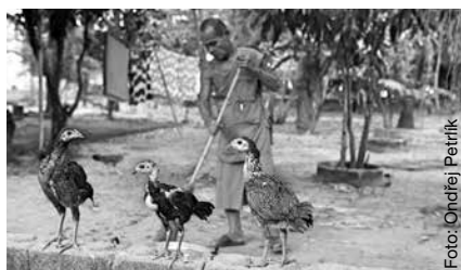
Slepičí vejce jako indikátor znečištění.

A nějaké dobré zprávy? Na rozdíl od vysokých hodnot při měření rtuti dopadly vzorky ryb v analýze na obsah POPs lépe, než se předpokládalo. Podobný závěr přinesly i testy na přítomnost polychlorova-