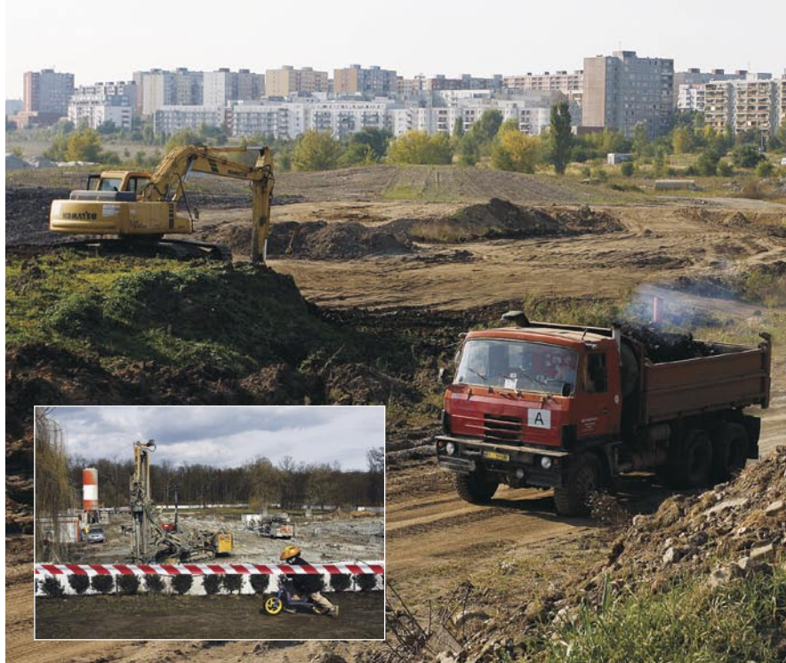
Výstavba golfového hřiště u Černého Mostu. Betonování obřího kráteru po propadu tunelu Blanka ve Stromovce.

Odpovědní zásilka – poštovně hraří adresát.