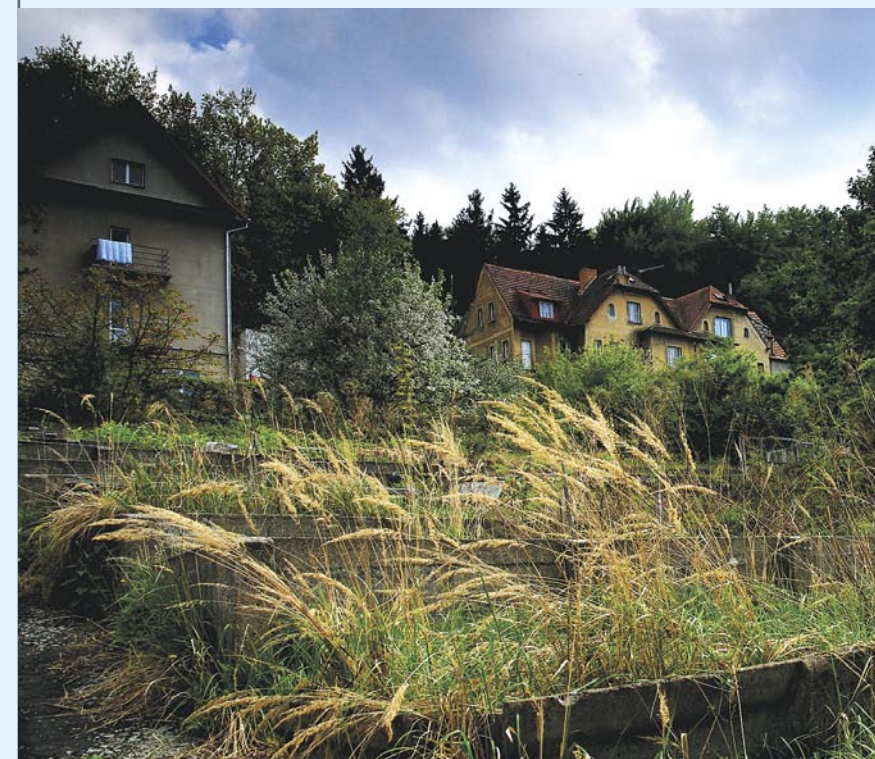
Bývalé Strnadovo zahradnictví ve Vokovicích se mělo podle slibů přeměnit ve velký park. Nyní hrozí celému území zástavba komerčními domy.

Navrhujeme zastavit projednávání CVZ I. a II. a území dotčená jednotlivými změnami řešit v rámci nového územního plánu Prahy.