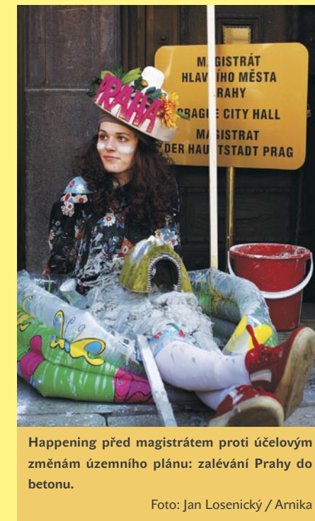
Happening před magistrátem proti účelovým změnám územního plánu: zalévání Prahy do betonu.