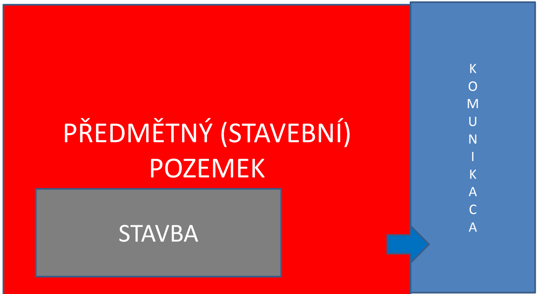
Schéma – I.