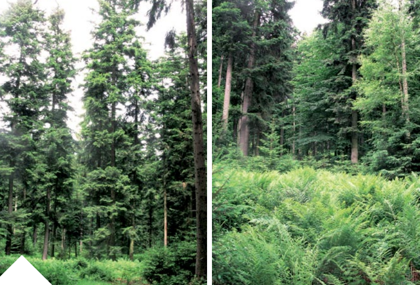
Unikátní jedlina je kvalitnější než jedlové lesy v Pošumaví. Tento les má pro svou zachovalost velký význam i z vědeckého hlediska.