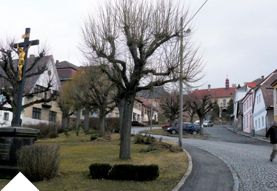
Náměstí v Ratajích zažívalo největší popularitu mezi výletníky v období první republiky. Posázaví je dodnes vyhledáváno pro své přírodní krásy i památky.