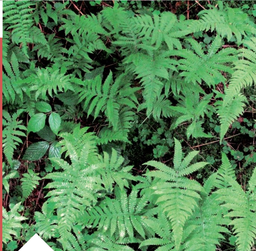
V bohatém bylinném podrostu jedlového lesa najdeme širokou škálu kapradin a hajních bylin. Zem pokrytá mechem zadržuje hodně vláhy.