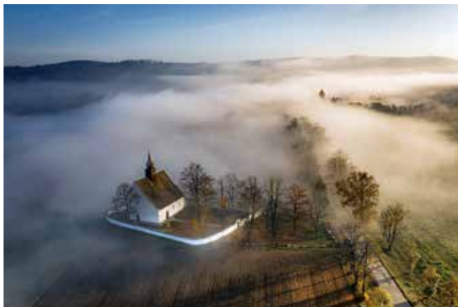
Na druhém místě se umístila fotografie lipové aleje u hradu Veveří.