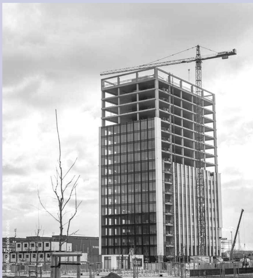
Autoři nového stavebního zákona obdrželi připomínky od desítek státních úřadů, ministerstev a odborných institucí.

Takový postup se ale může brzy vymstít. Legislativní zmetek s ohledem na ohromné množství a závažnost připomínek nelze opravit. Pokračování dalších prací je pouze plýtváním lidskými silami, finančními prostředky a ve svém důsledku i odkládáním řešení problému. Vláda by měla přípravu zastavit, začít zcela od začátku a naprosto