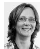
ARNIKA TOXICKÉ LÁTKY A ODPADY

Ryby jsou významným zdrojem omega-3 nenasycených mastných kyselin, které jsou naprosto nezbytné pro zdravý vývoj. Děti a těhotné ženy by ryby ze svého jídelníčku neměly vynechat, určitě by se však měly vyhnout dravým rybám. Znečištění vody i ryb budeme letos sledovat i nadále, a to u dalšího typu toxických látek – tzv. perfluorovaných sloučenin. O výsledcích se dozvíte v dalších číslech Arnika. ■