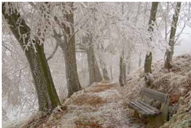
Třetí příčku obsadila císařská alej u Jáchymova.