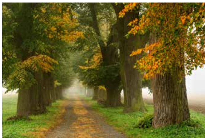
První místo ve fotosoutěži získala lipová alej v Zahrádkách.