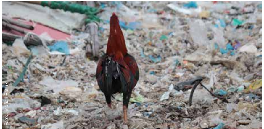
Kohout na skládce v Indonésii.

Naše studie vůbec poprvé prokázala kontaminaci potravního řetězce v Jihovýchodní Asii kvůli nesprávnému nakládání s dovezeným plastovým odpadem. Na tuto studii pak odkazovaly dvě reportáže prestižního amerického deníku The New York Times z listopadu a prosince loňského roku, které přímo zmínily i Arniku.