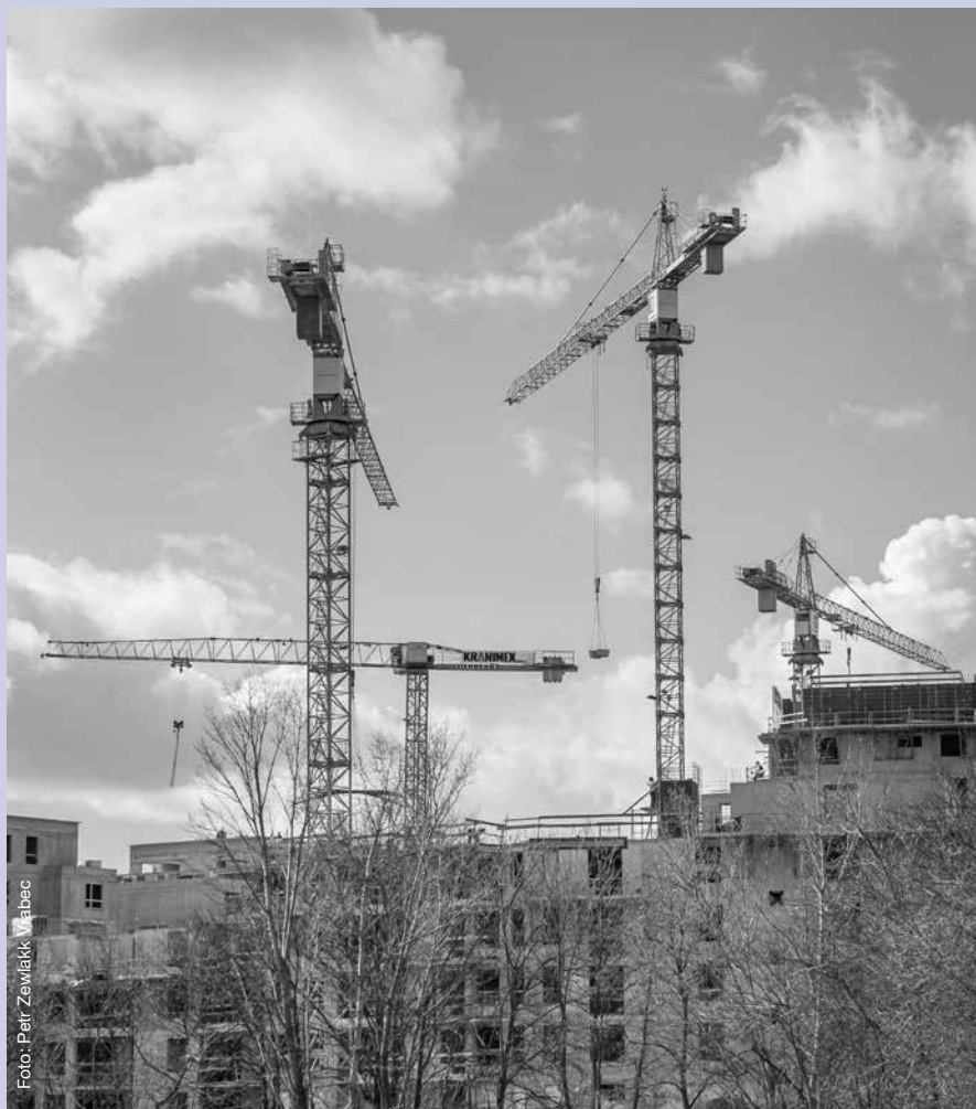
Příprava zákona je zatížena obrovským střetem zájmů.