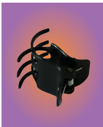
Die Mini-Haarklammern enthielten 207 ppm des bromierten Flammschutzmittels HBCD

Polybromierte Diphenylether (PBDE) sind eine Gruppe von Stoffen, die als hormonschädlich für den Menschen (endokrine Disruptoren, ED) bekannt sind. PBDE können die Funktion der Schilddrüse nachhaltig stören, die Entwicklung des Gehirns beeinträchtigen und das Nervensystem langfristig schädigen. Wissenschaftliche Untersuchungen haben einen Zusammenhang zwischen PBDE-Belastung und Aufmerksamkeitsdefiziten sowie Hyperaktivität bei Kindern (ADHS) nachgewiesen.