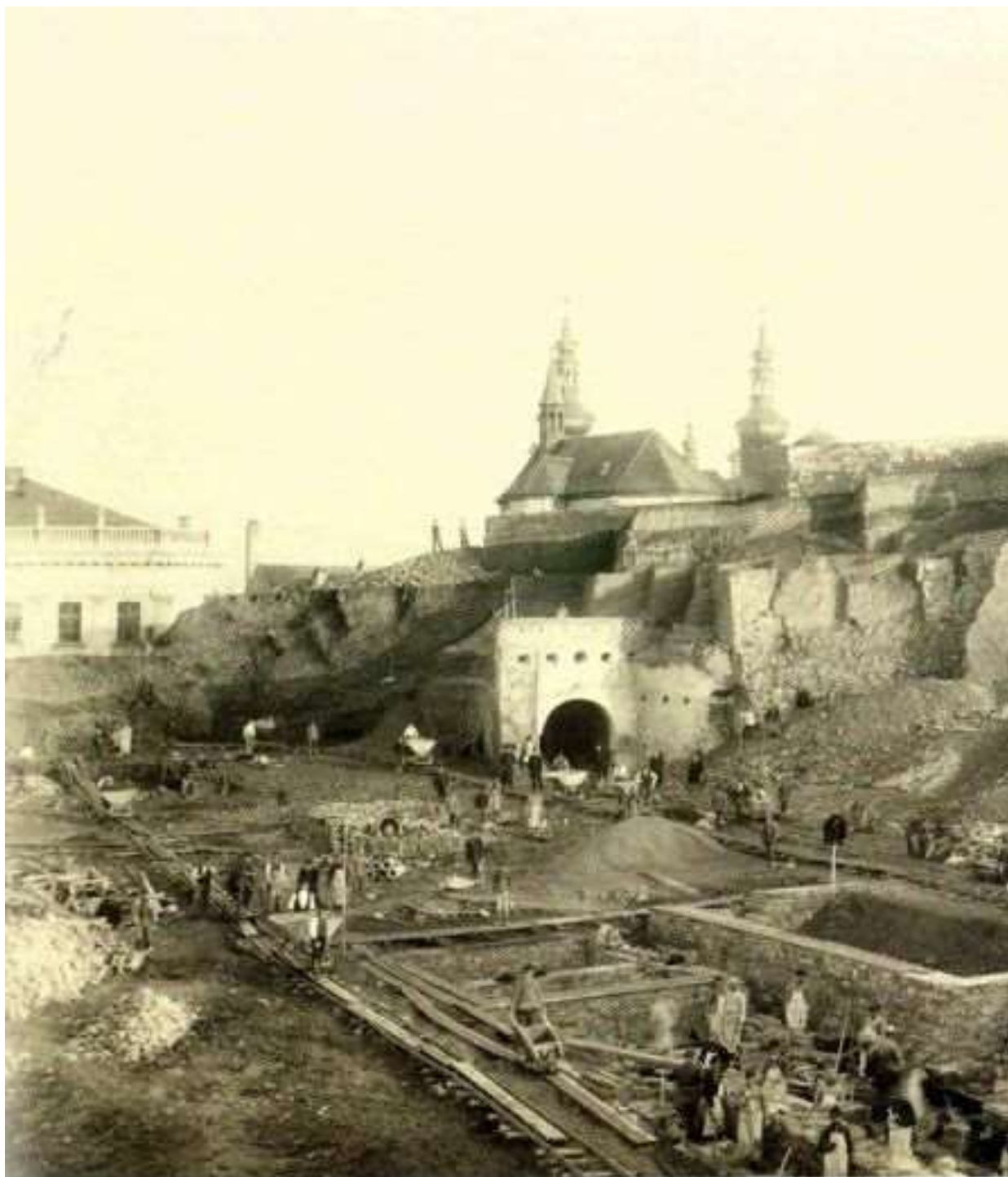
30 Bourání Strahovské brány, 1897, MMP H 011.541